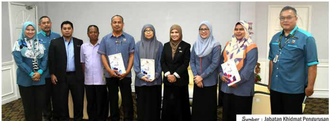
Sumber : Jabatan Khidmat Pengurusan

Program Pementoran ini diadakan sebagai mekanisme latihan untuk menyemarakkan pembelajaran dalam organisasi dan memperkukuhkan kompetensi penjawat awam agar sentiasa memberikan perkhidmatan terbaik kepada rakyat di daerah Kuala Selangor.