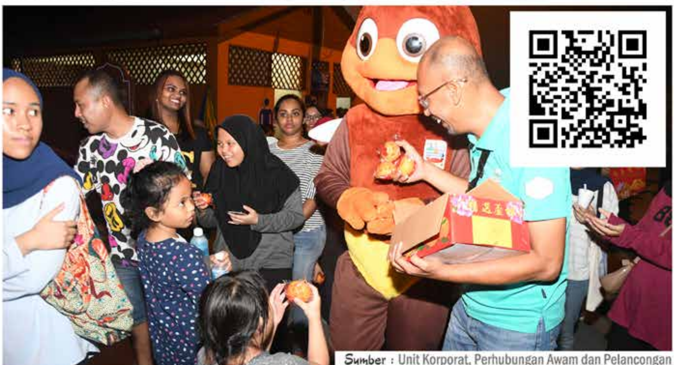
Sumber : Unit Korporat, Perhubungan Awam dan Pelancongan

Untuk mendapatkan maklumat lebih lanjut mengenai produk-produk pelancongan di daerah Kuala Selangor, orang ramai boleh mengimbas "QR Code" yang disediakan.